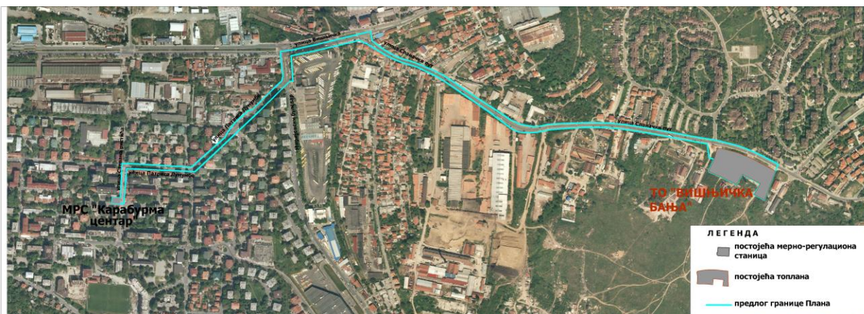
графички прилог бр. 1 : ПРЕДЛОГ ГАСОВОДНЕ МРЕЖЕ

ПРИВРЕДНО ДРУШТВО ЗА ПРУЖАЊЕ УСЛУГА У ОБЛАСТИ УРБАНИЗМА, АРХИТЕКТУРЕ И ГРАЂЕВИНАРСТВА „URBANIKA“ Д.О.О. БЕОГРАД – ЗВЕЗДАРА Булевар краља Александра број 235/83, 11000 Београд_ ПИБ 107689262 Тел: +381 (0)11 2410 466 и +381 (0)63 629 933_ e-mail: tanja.klismanic@gmail.com